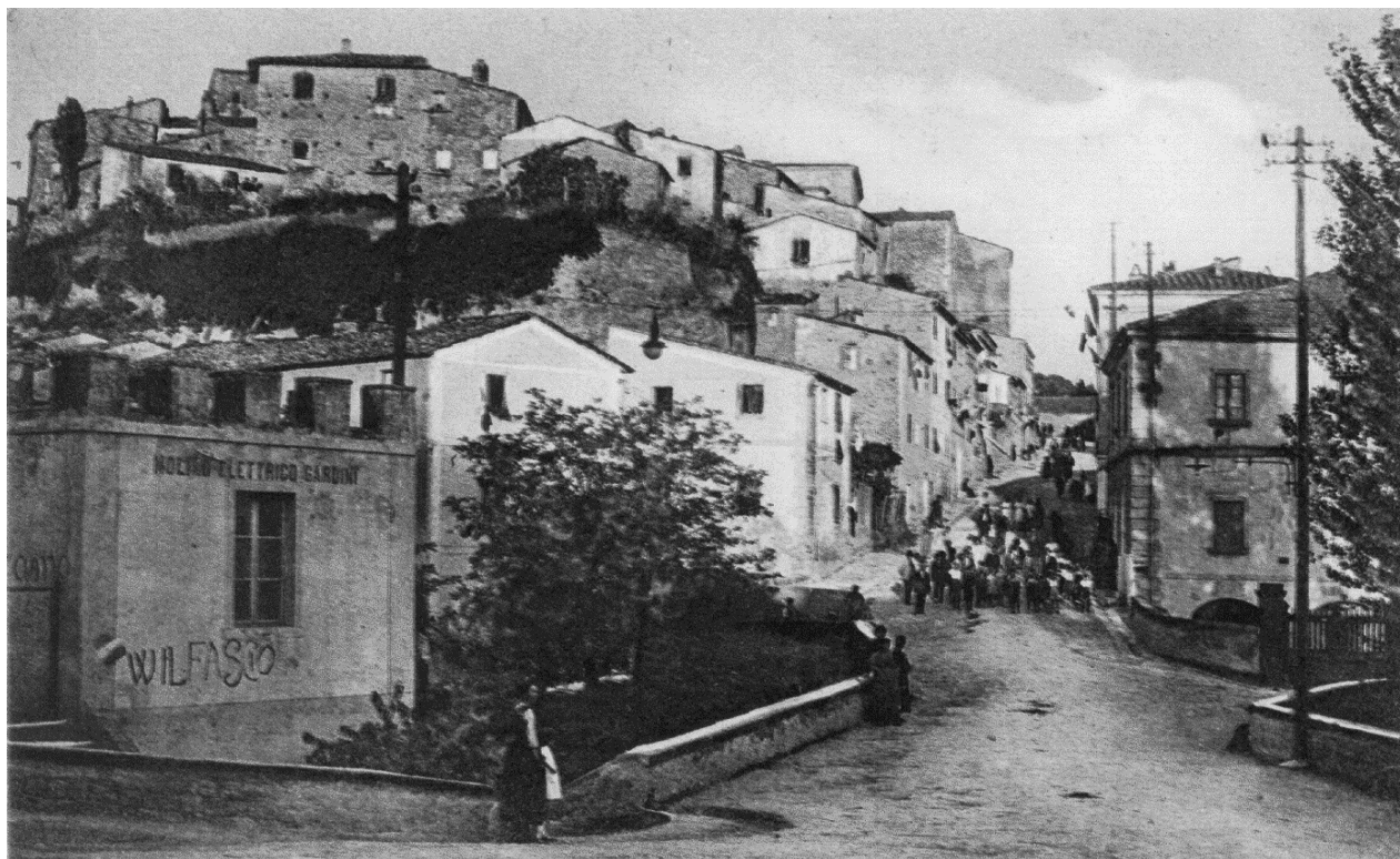
BIBBONA - Via Vittorio Emanuele

Curioso quanto accaduto recentemente a Portoferraio, la città in cui Gori morì nel 1911, dove nel 2018 la giunta di centro destra ha intitolato la centrale piazza Pietro Gori ad un ben più famoso ex sindaco elbano di nome Giovanni Ageno 20 !